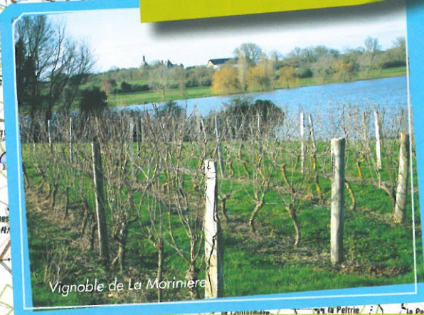
Vignoble de La Morinière