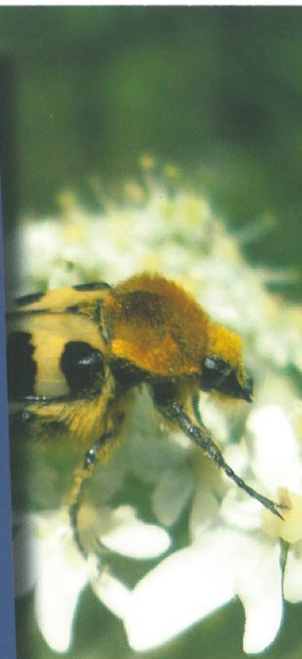
Trichius rosaceus ou tricki

Château de la Morinière (XVII e siècle). Château de Beaumont (XVIII e siècle). Il est situé sur le point culminant du sud de la Mayenne, à 101 mètres d'altitude. Ici se trouve le plus beau panorama de Saint-Denis-d'Anjou. Château de Martigné (XVII e siècle).